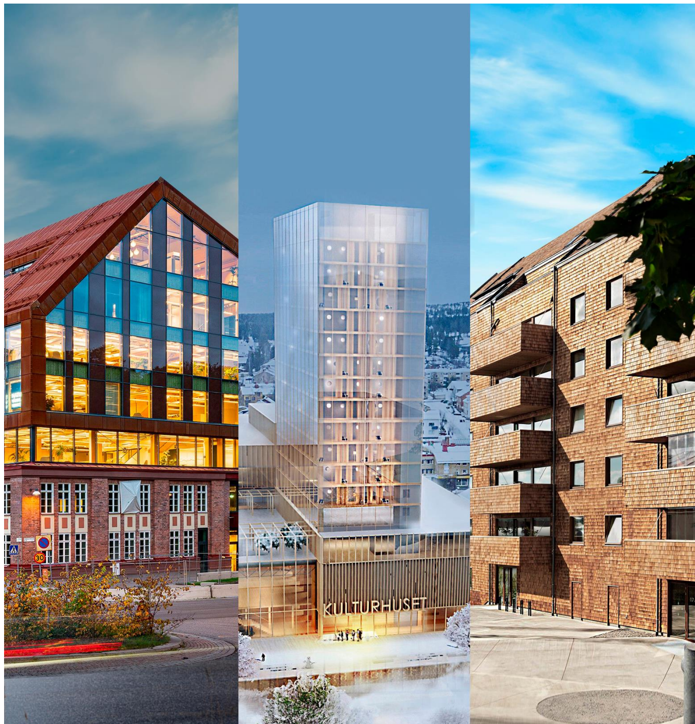
Foto: Petra Bindel/Arvet, Strandparken Christoffer Skogsmo/Tengbom, Trikafabriken Illustration-White Arkitekter, Sara kulturhus

Svenska institutet (SI) är en statlig myndighet som verkar för att öka omvärldens intresse och förtroende för Sverige. SI uppmärksammar exempelvis svenskt kunnande inom hållbart träbyggnande. Bilden visar SI:s kontor i Hammarby Sjöstad, Saga Kulturhus i Skellefteå samt Strandparken i Sundbyberg.