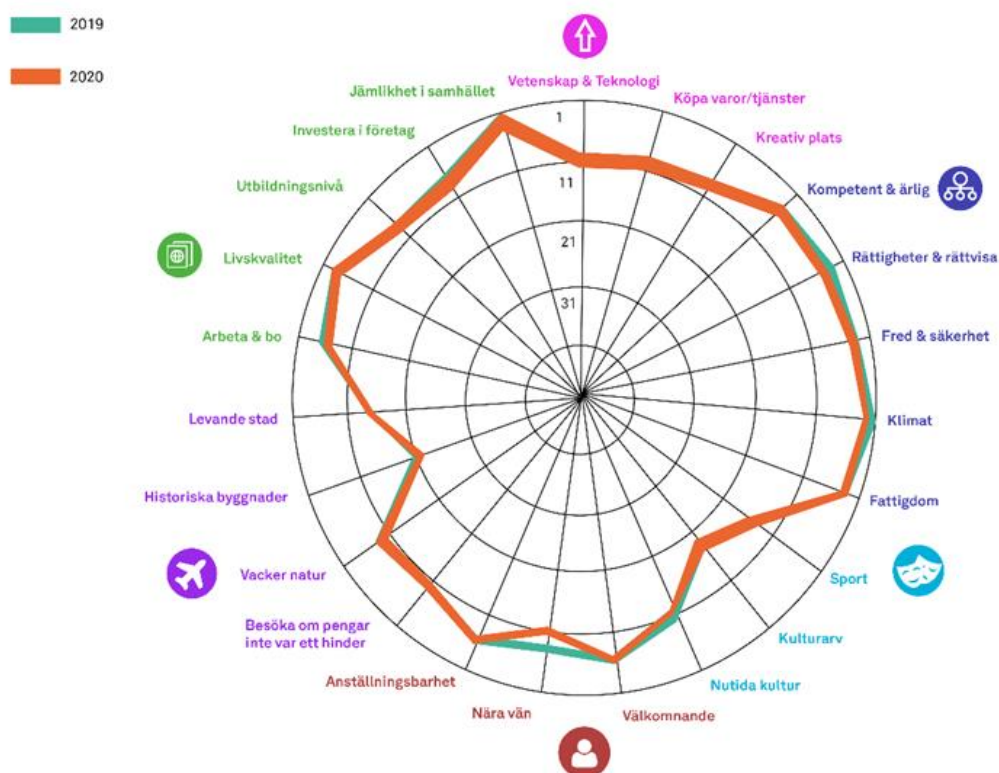
Figur 2: Sveriges placering i de 23 underkategorierna.