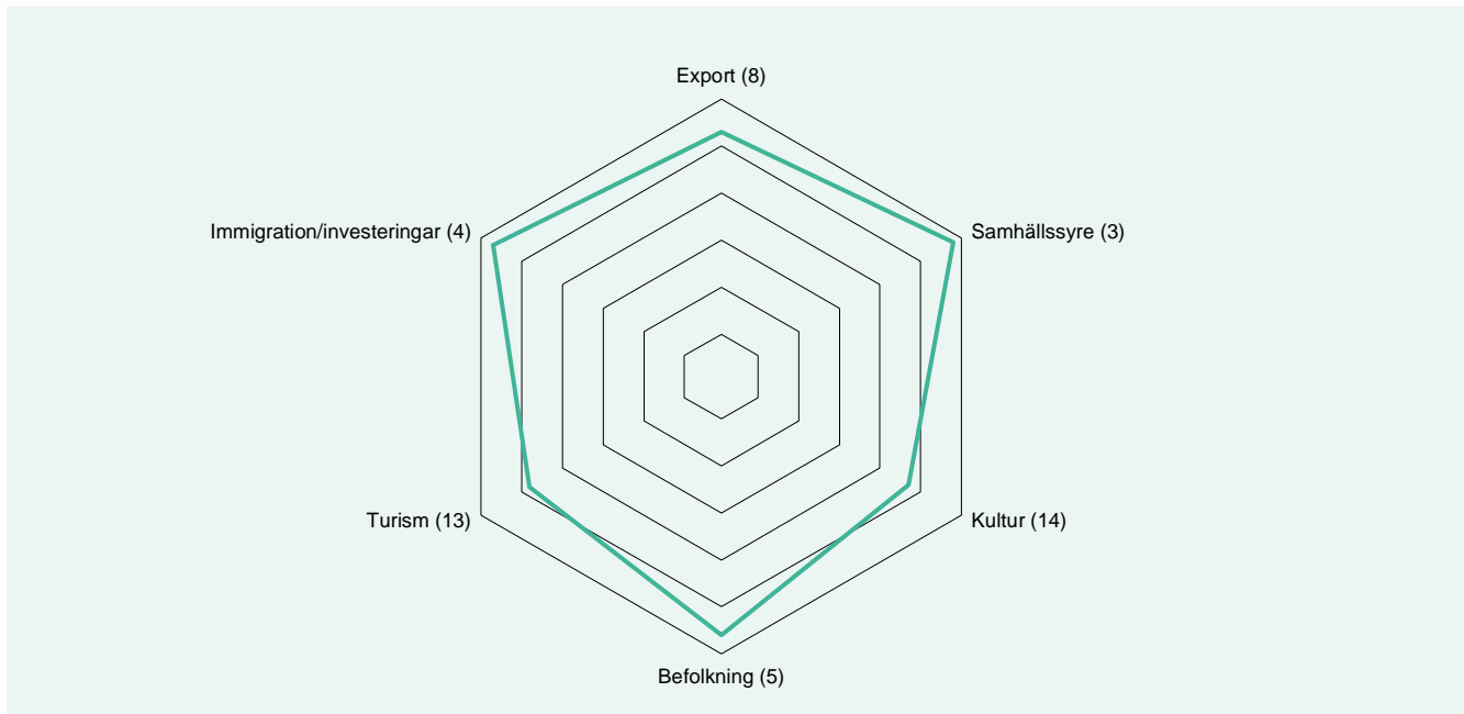
Figur 2: Sveriges placering i de sex kategorierna i NBI 2021. Sveriges ranking inom respektive kategori av 60 jämförda länder anges inom parentes.

Den främsta styrkan i Sveriges nationsvarumärke återfinns inom kategorin samhällsstyre. 2021 bibehåller Sverige plats 3 (3). 5 Sverige stiger en placering jämfört med föregående år inom kategorin immigration och investeringar till plats 4 (5). Den största förändringen i Sveriges ranking sett till enskild kategori är inom kategorin befolkning där Sverige 2021 stiger med tre placeringar jämfört med föregående år till plats 5 (8). Sett till poäng har Sveriges anseende förbättrats inom samtliga kategorier.