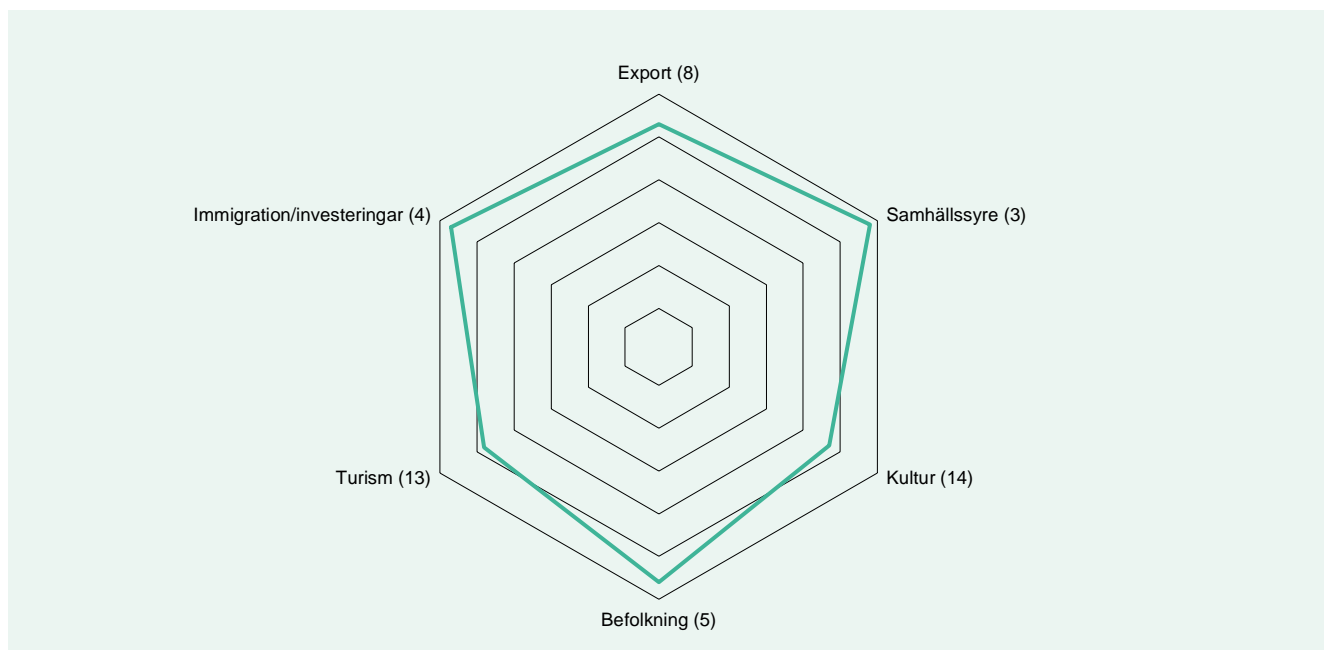
Figur 2: Sveriges placering i de sex kategorierna i NBI 2021. Sveriges ranking inom respektive kategori av 60 jämförda länder anges inom parentes.

Den främsta styrkan i Sveriges nationsvarumärke återfinns inom kategorin samhällsstyre. 2021 bibehåller Sverige plats 3 (3). 5 Sverige stiger en placering jämfört med föregående år inom kategorin immigration och investeringar till plats 4 (5). Den största förändringen i Sveriges ranking sett till enskild kategori är inom kategorin befolkning där Sverige 2021 stiger med tre placeringar jämfört med föregående år till plats 5 (8). Sett till poäng har Sveriges anseende förbättrats inom samtliga kategorier.